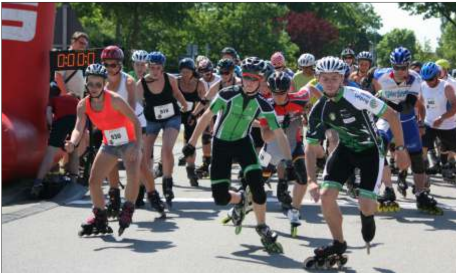
Start der Inline-Skater, die erstmalig dabei waren.