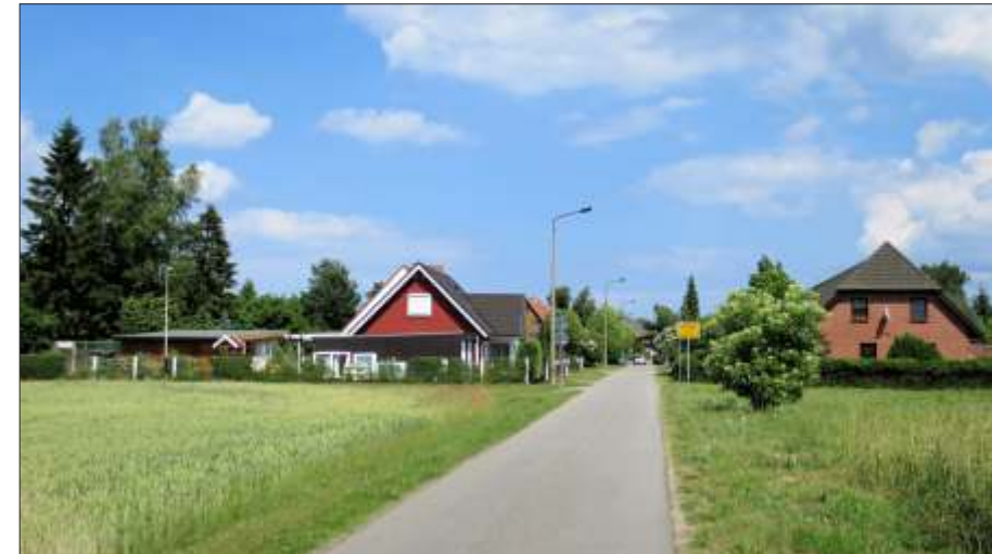
Der Ortseingang von Oldenhagen